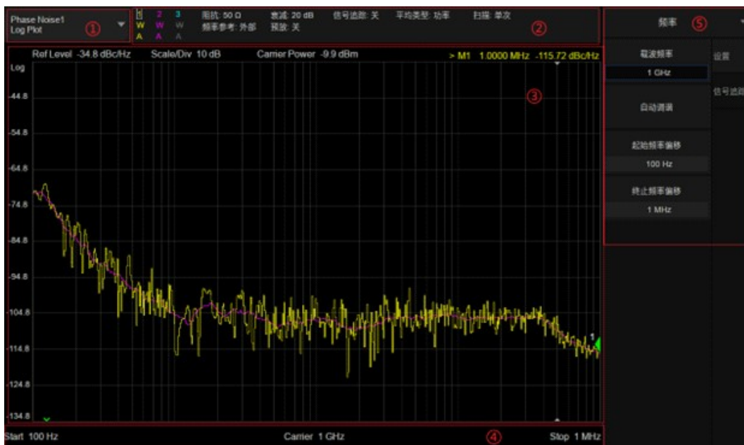
图 2 相噪分析功能操作界面