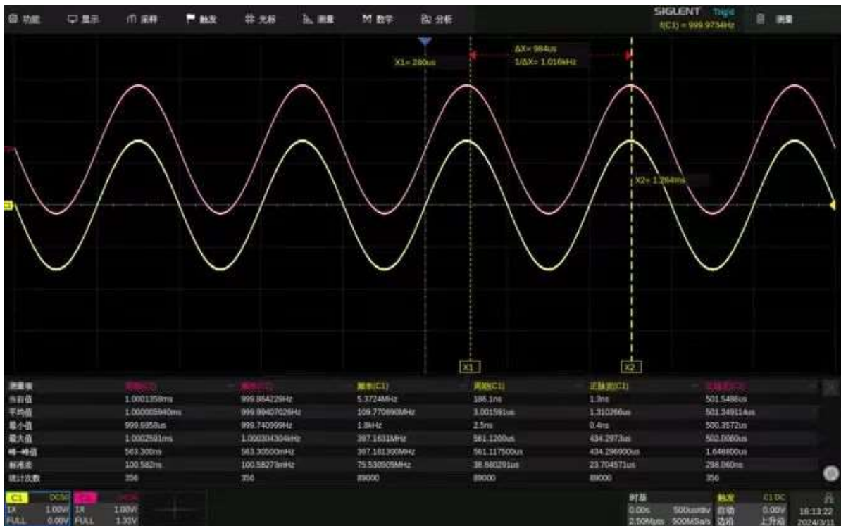
C1 波形测量值错误示意图

在测量结果中可以明显看到，C1 通道的几个测量项统计结果均远远大于 C2 通道的，数据选取量更多。C2 通道中针对周期的统计次数每次增加 4 次，根据手册我们了解到示波器计算周期的方式，从上升沿 50%幅值处至下一个上升沿的 50%幅值处为一个周期，图中显示的可计算周期数确实为 4 个，由此可见 C1 通道参数测量中混入了许多其他的取样点，推测可能是阈值电平设置不当导致的。